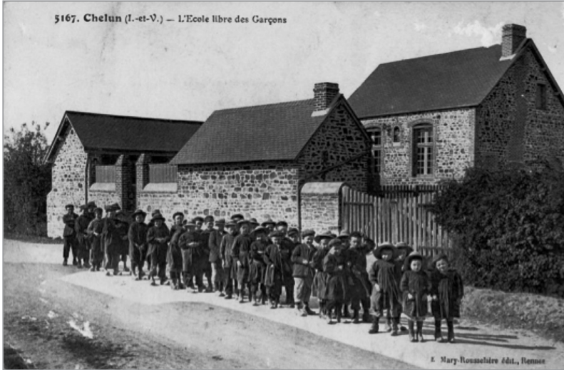
Illustration 2 L'école libre des garçons de Chelun

Ouverte à la rentrée 1912, suite au changement de maire, elle attire rapidement la plus grande partie des élèves à tel point qu'à la rentrée 1914, l'école publique des garçons, tenue par François Louvel, ne compte plus qu'un élève. Les 35 enfants que l'on compte sur cette photo laissent supposer qu'elle a été prise fin 1912.